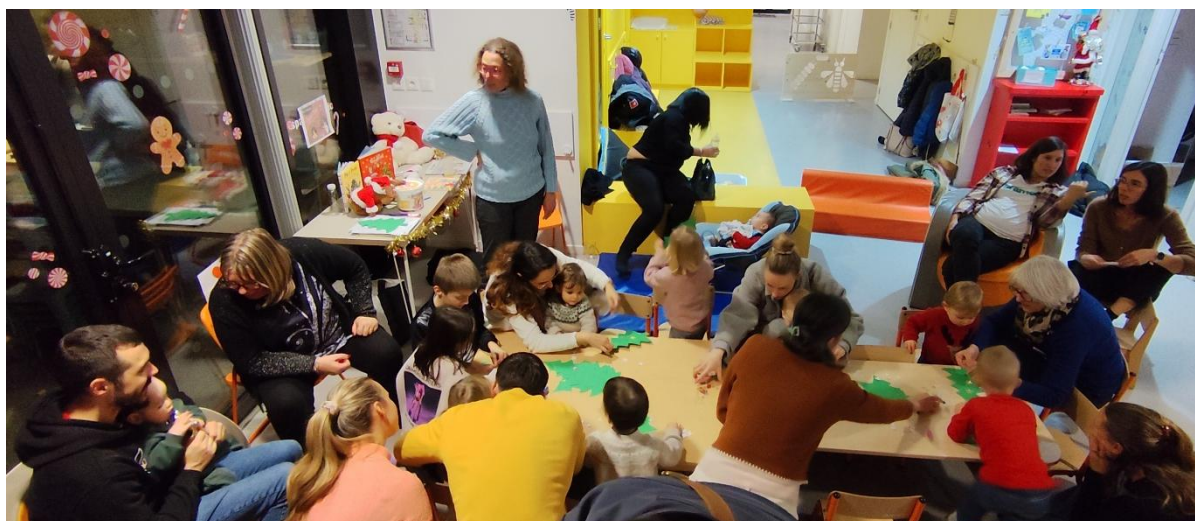
A Vaulnaveys le haut avec les assistantes maternelles et les parents