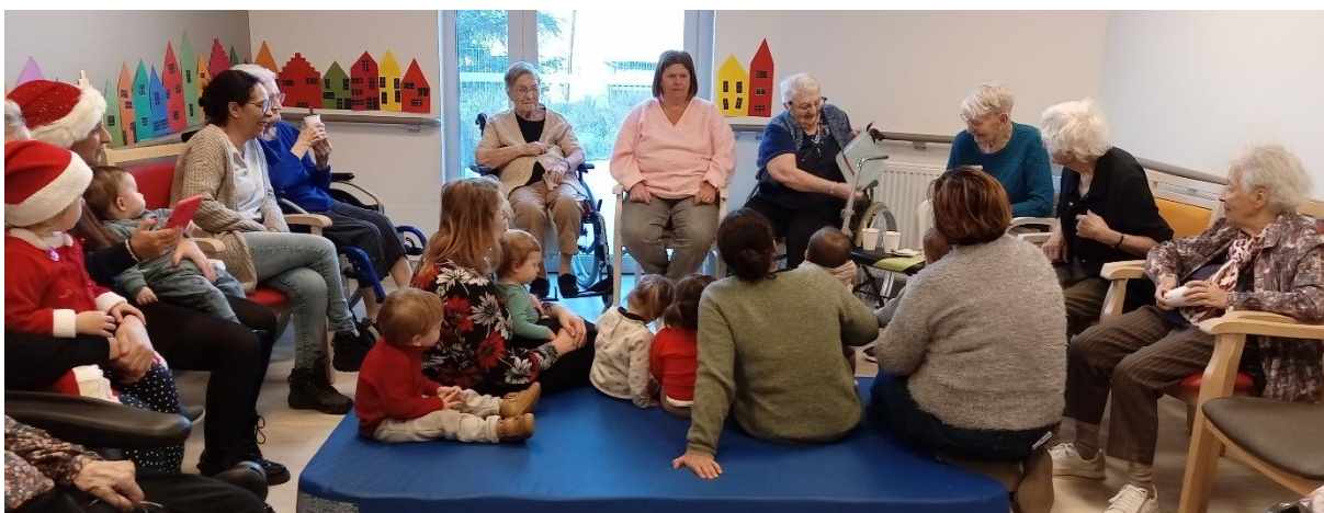
A Vizille, avec les résidents de la résidence autonomie la Romanche et de l'EHPAD les Ecrins