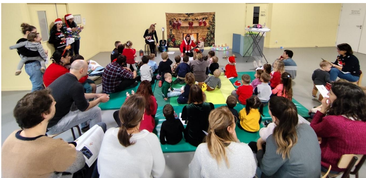
A Séchillienne, avec les assistantes maternelles, les parents, et les enfants de l'école maternelle.