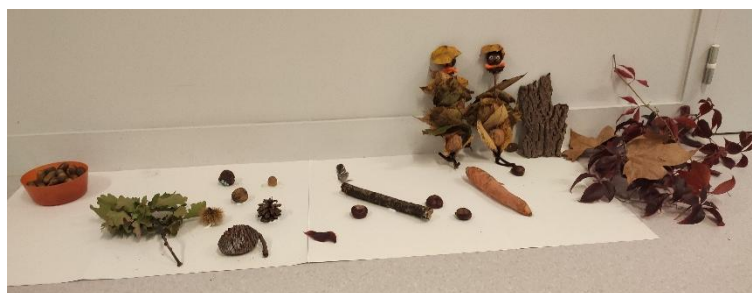
Colchiques dans les prés